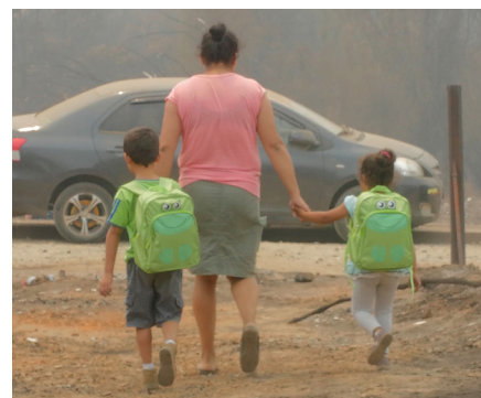
Primera versión de la Mochila entregada en los incendios del verano 2017.

No corresponde la entrega de este kit en ningún otro caso no especificado en este punto o en punto 6 (protocolo de excepciones). Corresponde a un bien valorado por lo cual el cumplimiento de este protocolo de entrega puede ser objeto de auditoría interna o externa en cualquier momento.